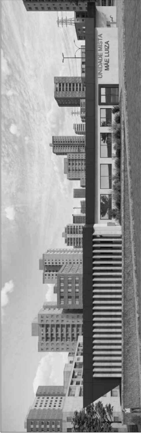
PERSPECTIVA SEM ESCALA