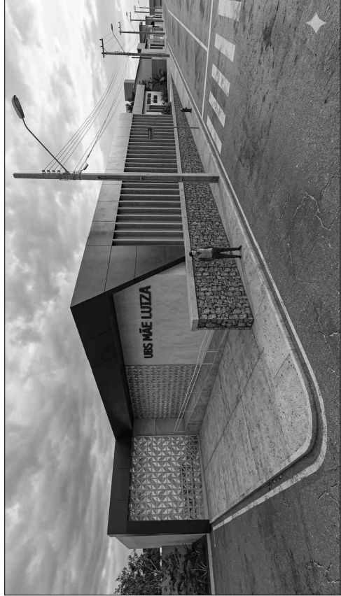
PERSPECTIVA SEM ESCALA